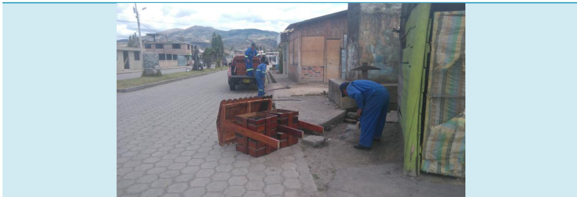
MODELO DE TACHOS PÚBLICOS INSTALADOS AV. LOS DINOSAURIOS 04 de octubre del 2016