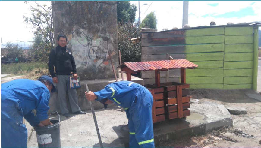
MODELO DE TACHOS PÚBLICOS INSTALADOS PLAZA CENTRAL DEL BARRIO CUESACA 04 de octubre del 2016