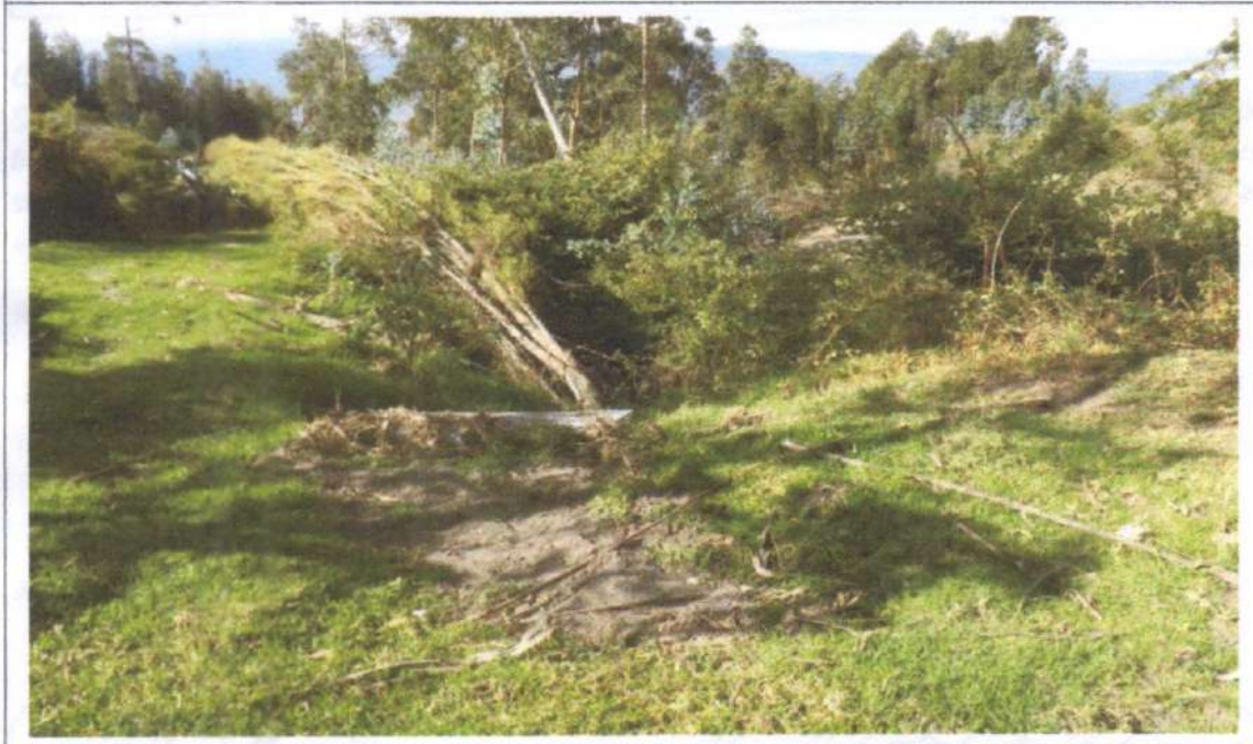
Fin del alcantarillado (Quebrada Duendes)

El motivo del presente tiene la finalidad de comunicar que se ha realizado un seguimiento al proyecto "Construcción del Alcantarillado Sanitario del barrio San Joaquín" ; verificándose que existe una alteración en la calidad de los componentes ambientales agua, suelo, aire, biótico, social, , debido a la ausencia de un sistema de tratamiento de las aguas residuales.