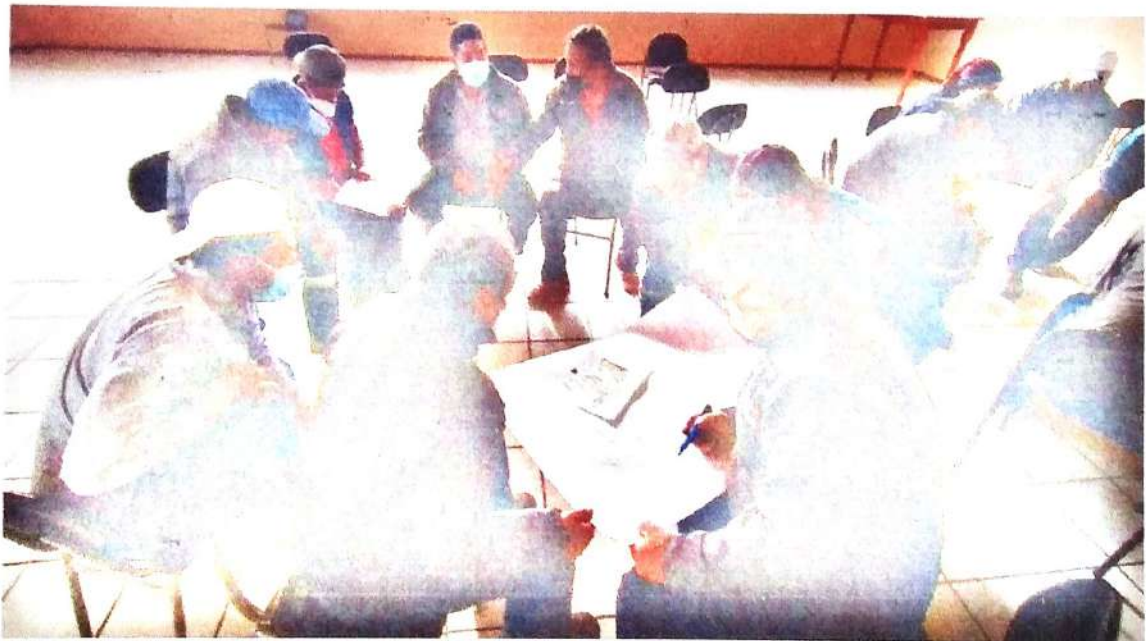
Taller Acto y condición insegura