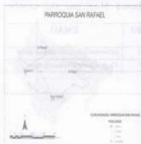
Figura 1. Ubicación del lugar a intervenir