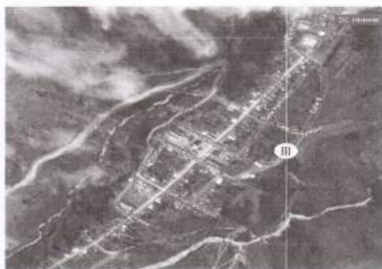
Figura 2. Mapa base de la cabecera parroquial Monte Olivo

La Calle Carchi donde se realizará la intervención descrita en este proyecto, se ubica en la cabecera parroquial de Monte Olivo. En la figura 2 se puede observar la ubicación del lugar donde va a realizar la construcción del adoquinado.