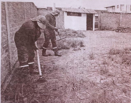
Adecentamiento de espacios públicos en Bolívar.

BOLÍVAR.- Para preservar los espacios e instalaciones públicas en el cantón Bolívar, desde el cabildo se empezó con los trabajos de adecentamiento de varios espacios que permanecían descuidados.