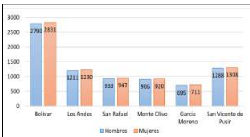
Figura 3. Distribución de la población por sexo

De la población total, 7.823 son hombres que corresponde al 49,61% de la población total y 7.947 mujeres que corresponde al 50,39%. La población tiene una presencia alta en la zona urbana de Bolívar, conforme se puede observar en la siguiente figura.