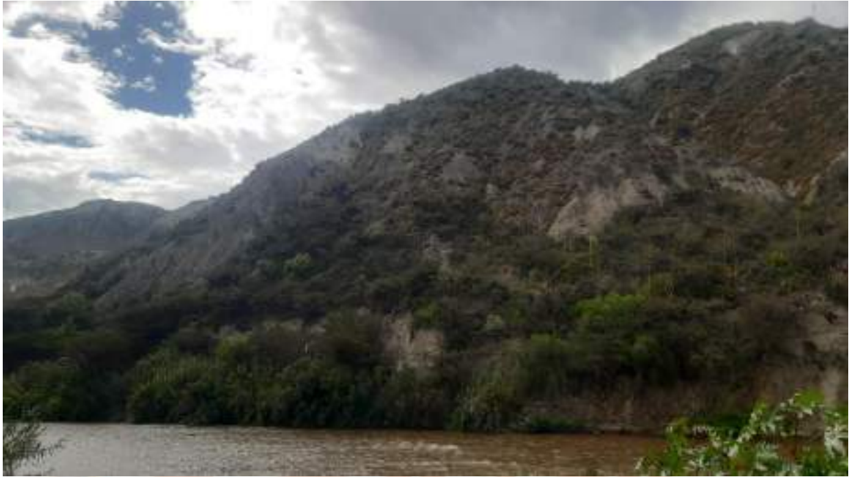
Fotografía 1. Área Minera Artesanal “Dragones del Río”