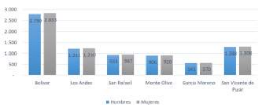
Ilustración 1. Distribución de la población por sexo

En cuanto a la distribución por sexo a nivel parroquial se presenta de la siguiente manera: