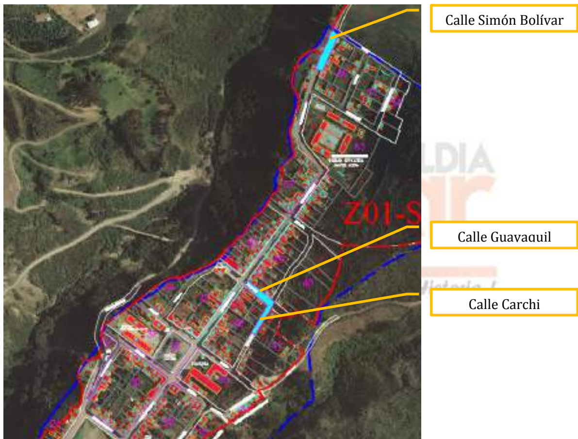
Figura 3. Calles a intervenir en la cabecera parroquial de San Rafael

Con el presente proyecto se van a intervenir las calles Simón Bolívar, la calle Carchi y Guayaquil de la cabecera parroquial de Monte Olivo. En la siguiente figura se indican los lugares específicos que contempla la intervención.