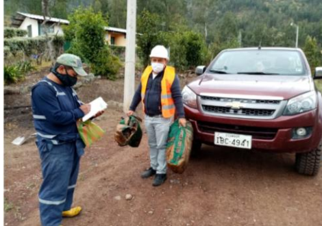
Tachos verde organicos y negro inorganicos