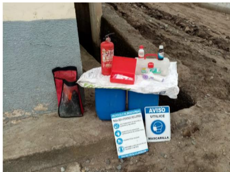
Alcohol y gel