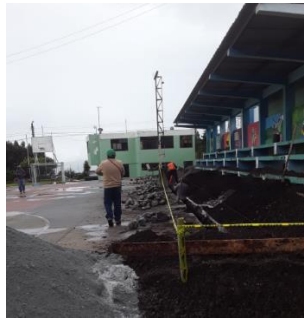
Cinta de seguridad