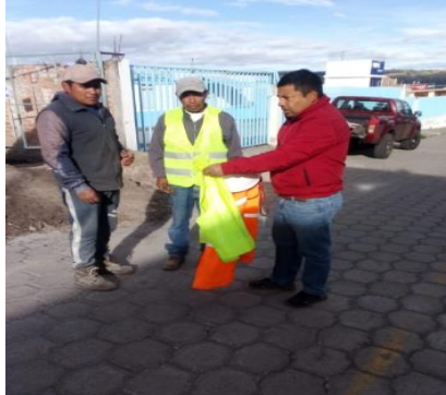
Entrega de casco, chaleco, guantes San francisco de Villacis