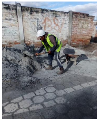
USO DE EEP