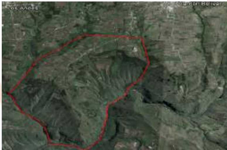
FIGURA N° 1 DELIMITACIÓN DE LA COMUNIDAD DE SAN JOAQUÍN