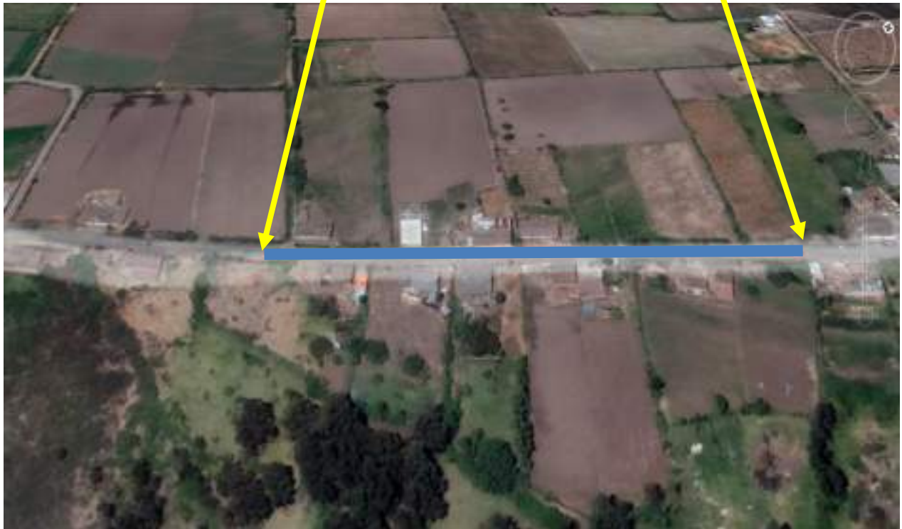
Figura 1. Ubicación del lugar a intervenir