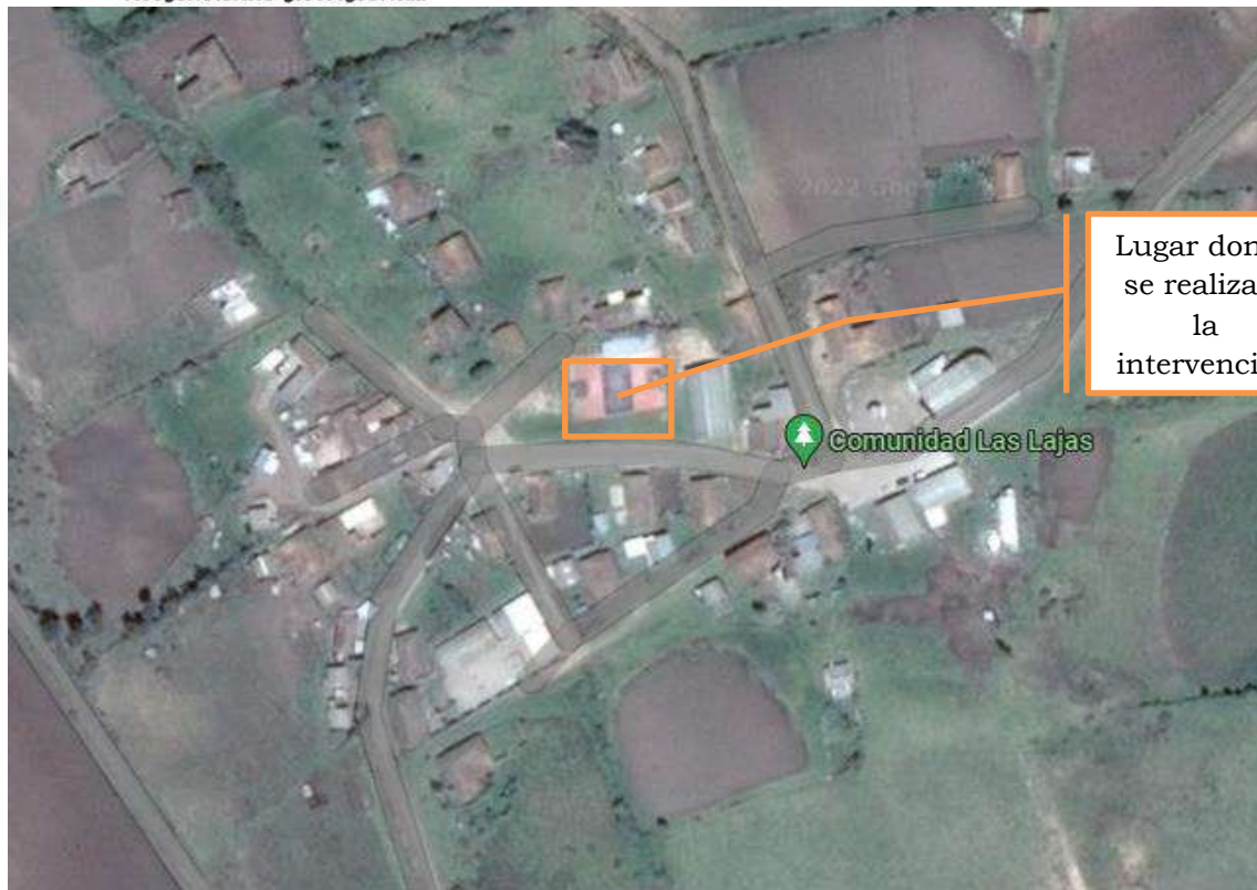
Imagen 1. Lugar de intervención.

La comunidad Las Lajas es una de las comunidades que se encuentran en la parte más alta se ubica en el mesotérmico húmedo, el mismo que avanza hasta los 3200 metros de altura, por lo tanto, su clima es frío y húmedo.