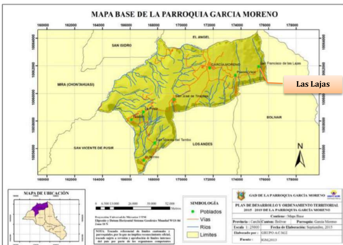
Figura 2. Mapa base de la parroquia García Moreno

La Parroquia García Moreno cuenta con una superficie aproximada de 54km 2 , se ubica al nororiente del cantón Bolívar, provincia del Carchi, al norte limita con las parroquias El Ángel (urbana) y San Isidro del cantón Espejo; hacia el este con la parroquia Bolívar (urbana); al sur con las parroquias Los Andes y San Vicente de Pusir y al poniente con la parroquia Mira (urbana) del cantón Mira. La Parroquia está conformada por 6 comunidades Las Lajas, Pueblo Viejo y parte de Yascón y tres centros poblados consolidados: El Tambo, San José de Tinajillas y su cabecera Parroquial García Moreno (PDOT García Moreno, 2020).