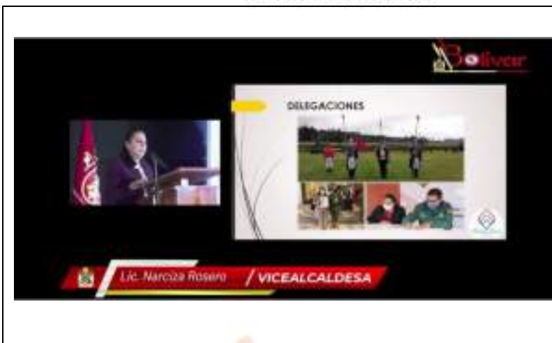
Fotografía 4. Presentación del Informe de Rendición de cuentas de la Sra. Narcisa Rosero Vicealcaldesa del cantón Bolívar