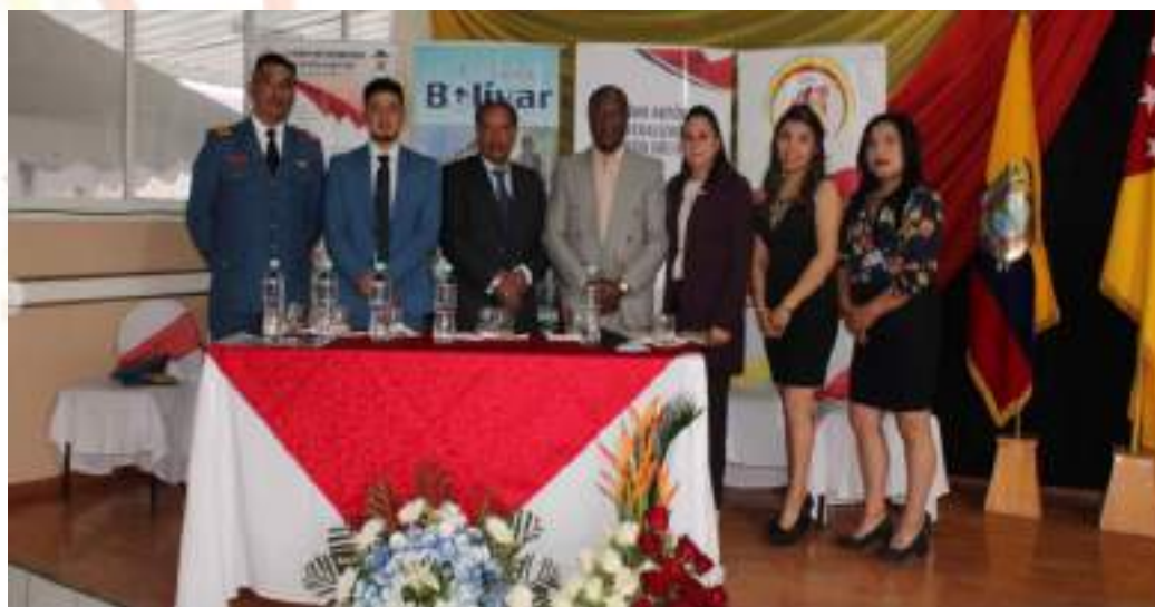
Fotografía 10. Rendición de cuentas 2021.