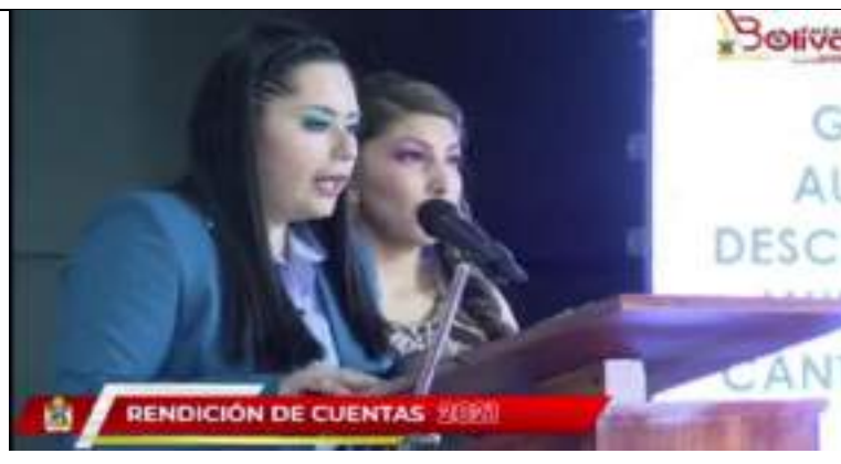
Fotografía 9. Respuesta a las preguntas planteadas por la ciudadanía.