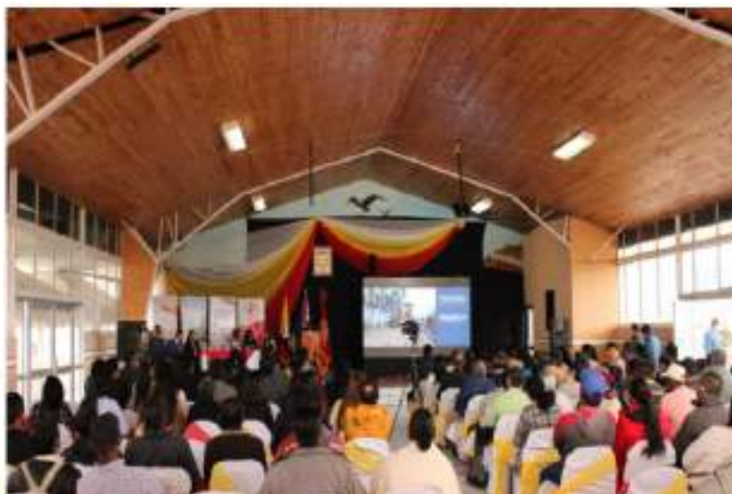
Fotografía 1. Asistentes a la Rendición de Cuentas 2021