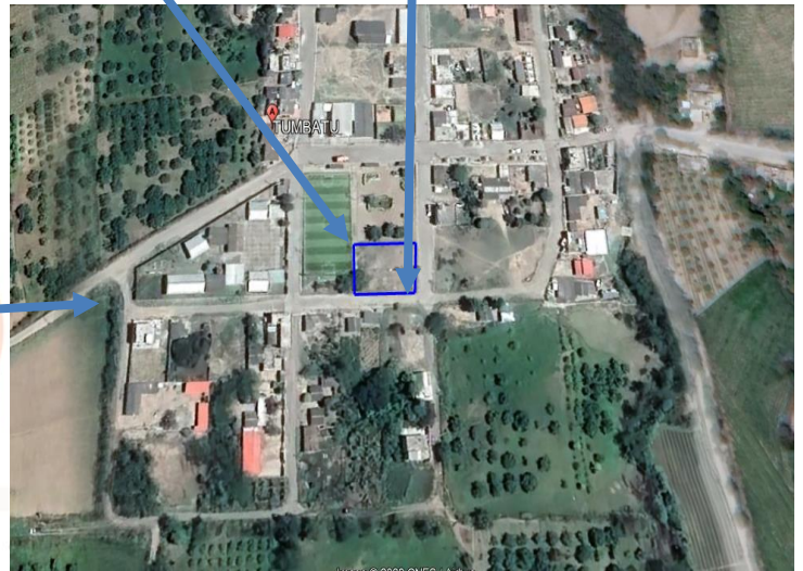
Figura 1. Ubicación del lugar a intervenir