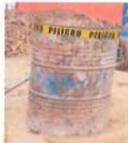
1 Recipiente de 200 L.

Anexo 3. El agua es almacenada en un recipiente de 200l para evitar el mal uso de este líquido y utilizarlo el requerido para la realización de hormigón.