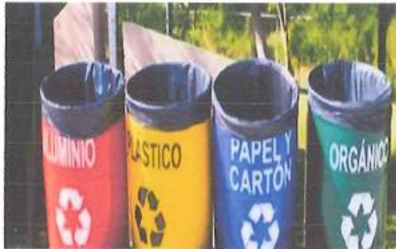
Tachos para desechos orgánicos e inorgánicos

Anexo 1. Se ubica un contenedor adecuado para la disposición y clasificación de desechos en el sitio.