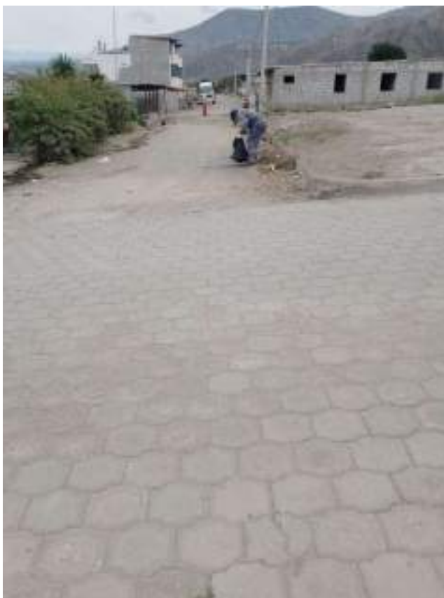
MANTENIMIENTO ESPACIOS PÚBLICOS Limpieza Calles, Caldera Octubre 2025