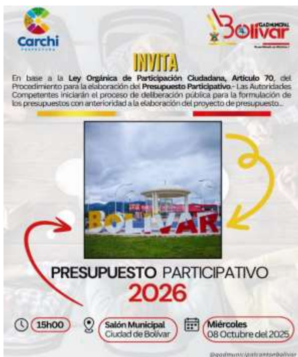
EJECUCIÓN DEL PRESUPUESTO PARTICIPATIVO 2026