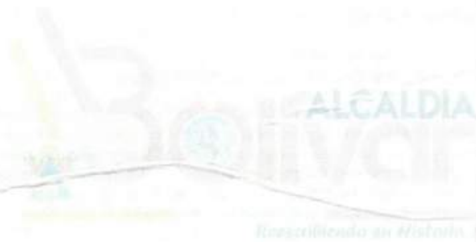
PRESIDENTE DE LA JUNTA PARROQUIA DE LOS ANDES